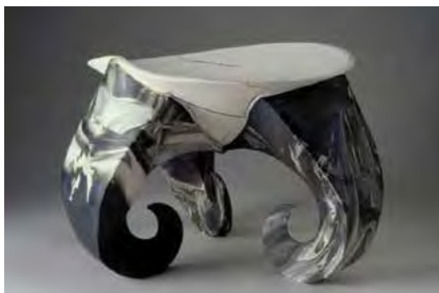
SZÜCS Zsuzsanna: Tál | Zsuzsanna SZÜCS: Bowl 2002, színezett porcelán, 37x35x25 cm