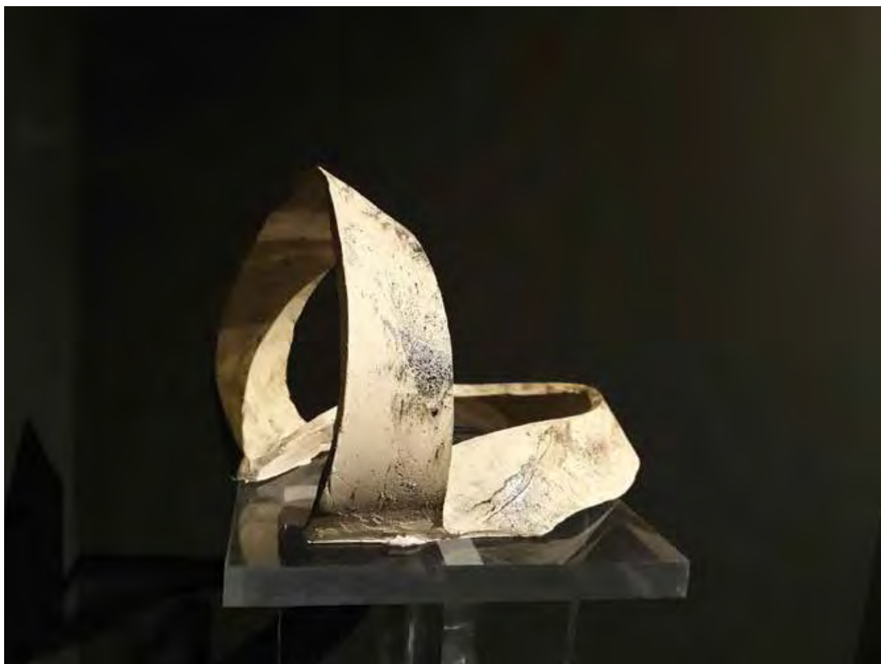
SZŰCS Zsuzsanna: Szalag | Zsuzsanna SZŰCS: Ribbon | 2019, samott, 25x32x16 cm