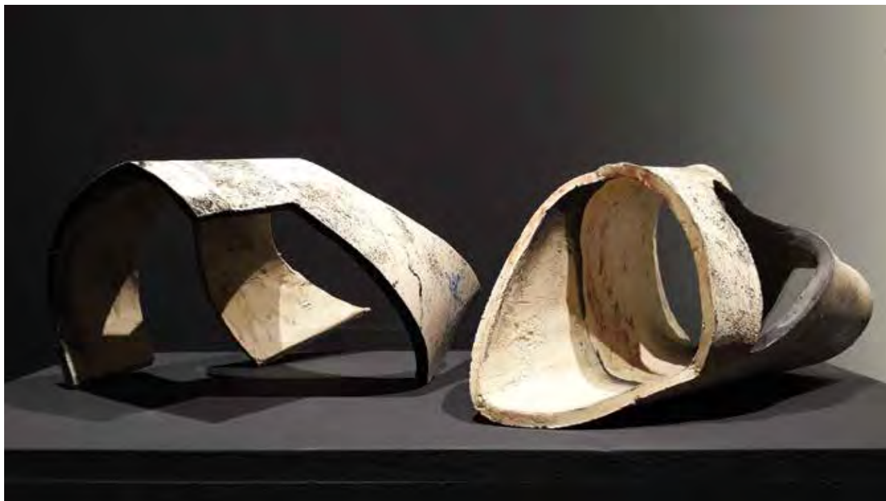
SZŰCS Zsuzsanna: Kívül (balra) és Árnyék | Zsuzsanna SZŰCS: Outside (left) and Shadow | 2019, samott, 22x28x16 cm és 32x18x14 cm